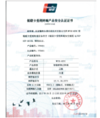
银联认证-安全认证证书