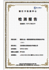
银联认证-银联智能销售点安全评估 (2.0)